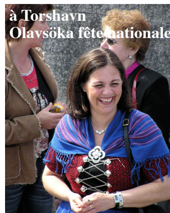
à Torshavn Olavsöka fête nationale

N'oubliez pas : sac de couchage, jumelles, médicaments personnels, alcool si vous le désirez (on en trouve pas sur place), passeport valable (éventuellement carte